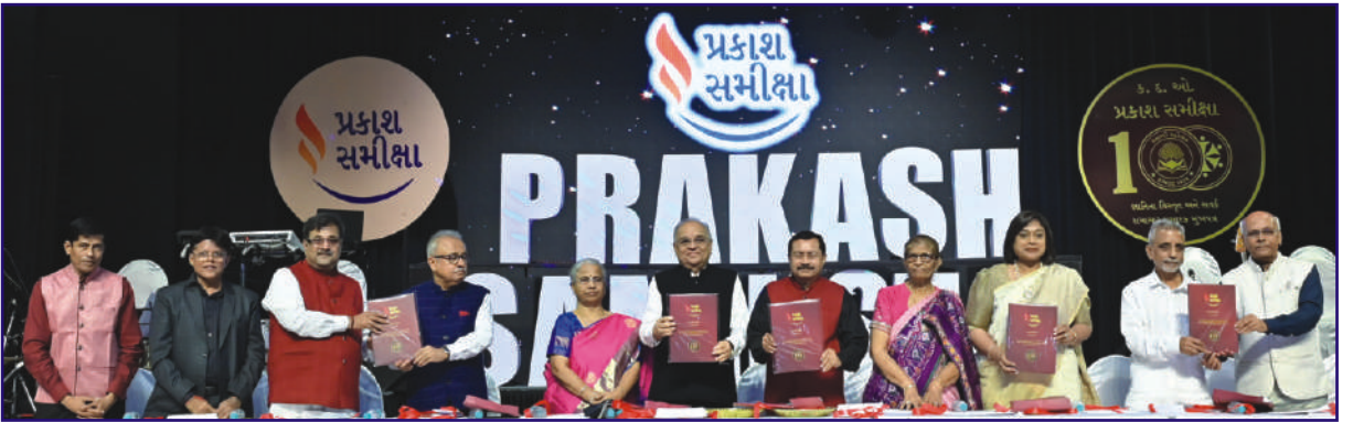
પ્રકાશ સમીક્ષા શતાબ્દી મહોત્સવ પ્રસંગે પ્રકાશિત 'શતાબ્દી વિશેષ' કોફી ટેબલ બુકનું વિમોચન