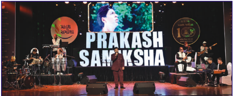
મ્યુઝીકલ ઓરકેસ્ટ્રા : સદાબહાર ગીતોં કા ગુલહસ્તા