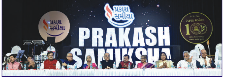
મંચ ઉપર ઉપસ્થિત પ્રકાશ સમીક્ષા ટ્રસ્ટી મંડળ