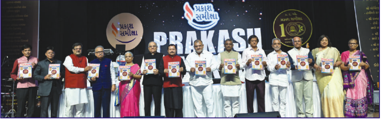
પ્રકાશ સમીક્ષા શતાબ્દી મહોત્સવ પ્રસંગે પ્રકાશિત 'સ્મૃતિ વિશેષ' અંકનું વિમોચન