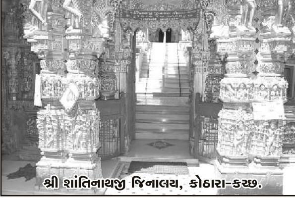
શ્રી શાંતિનાથજી જિનાલય, કોઠારા-કચ્છ.